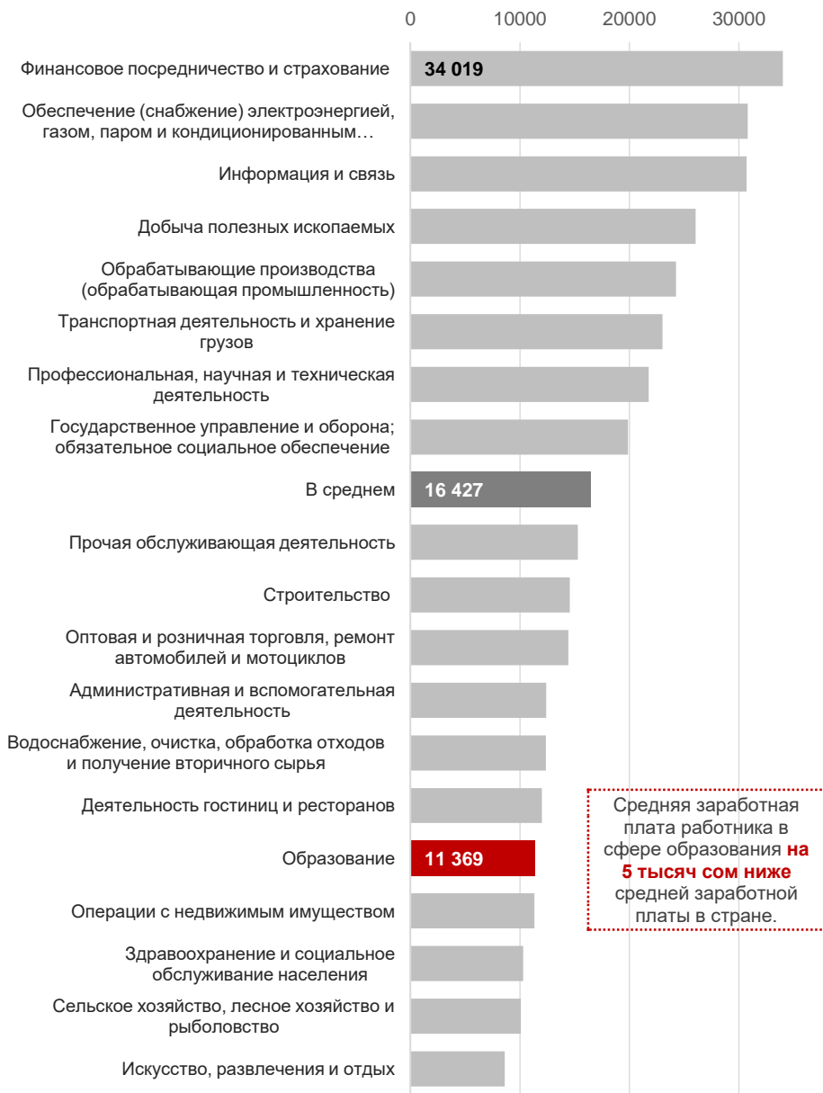
Рисунок 2 – Средняя заработная плата в Кыргызстане по видам экономической деятельности в 2018 году, сомов