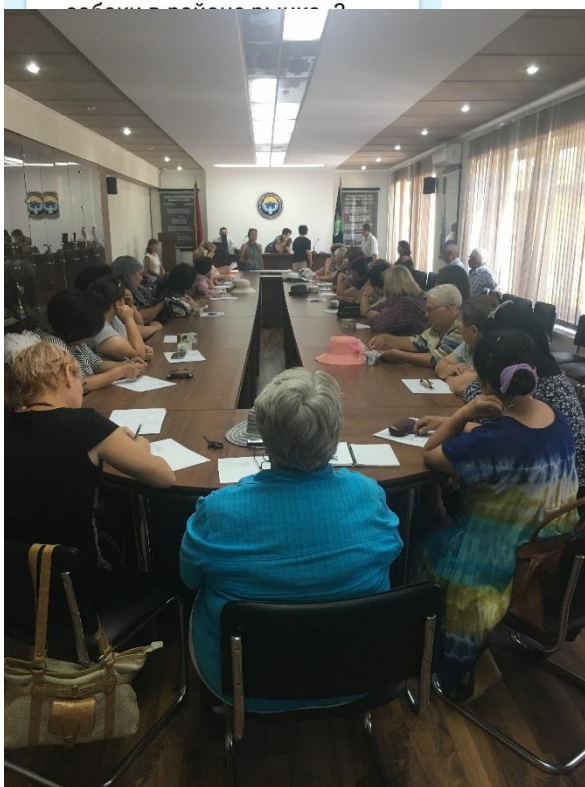
План и график работы рабочей группы г. Кара-Балта